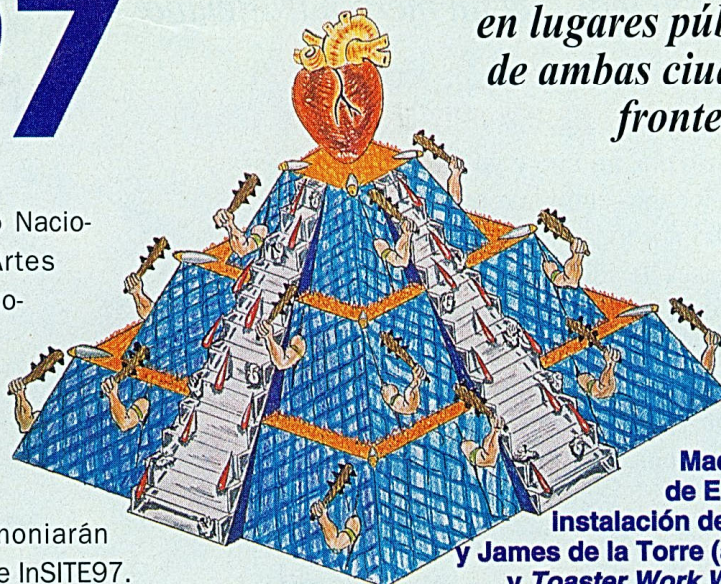
Maquetas de El Niño, Instalación de Einar y James de la Torre (arriba) y Toaster Work Wagon, de Kim Adams (abajo).

vés del Instituto Nacional de Bellas Artes (INBA), en colaboración con Installation Gallery de San Diego. Al final, dos publicaciones bilingües testimoniarán las actividades de InSITE97.