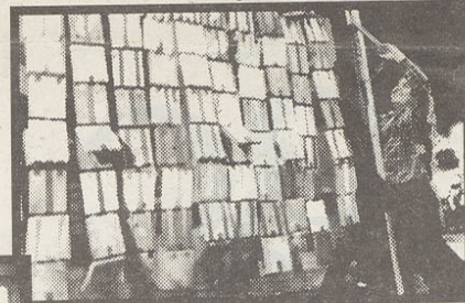
"Idioma de esclavos", de Angel Benson

"El asesino de sueños", de Rubén Bonet, pieza referencial a Freud. Un papalote atado. Cómo la descripción del mundo moderno nos ha limitado.